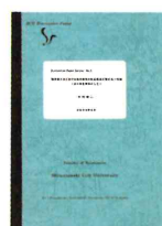
*ディスカッション・ペーパー