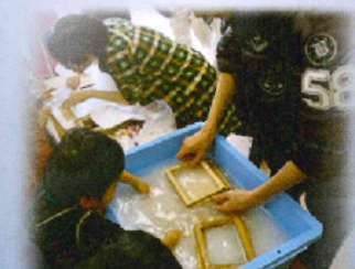
学生によるワークショップ、紙すき体験

2月3日(水)に、「下関市立大学唐戸サテライトキャンパス」が市内唐戸商店街にオープンしました。唐戸サテライトキャンパスでは、唐戸地区の賑わいや地域コミュニティの活性化に貢献できるよう、地元商店街や下関地域のコミュニティに関する調査研究や、様々な講座及びイベントを企画しています。