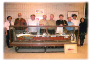
*クジラ研究家資料室訪問

日時: 平成21年10月5日(月) 場所: 下関市立大学鯨資料室 鯨に關係の深い国内各地を視察するために日本を訪れていた、欧米のクジラ研究家6名のグループが鯨資料室を訪問しました。