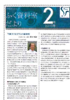
*ふく資料室だより