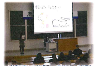
*鯨資料室シンポジウム 高校生による鯨研究